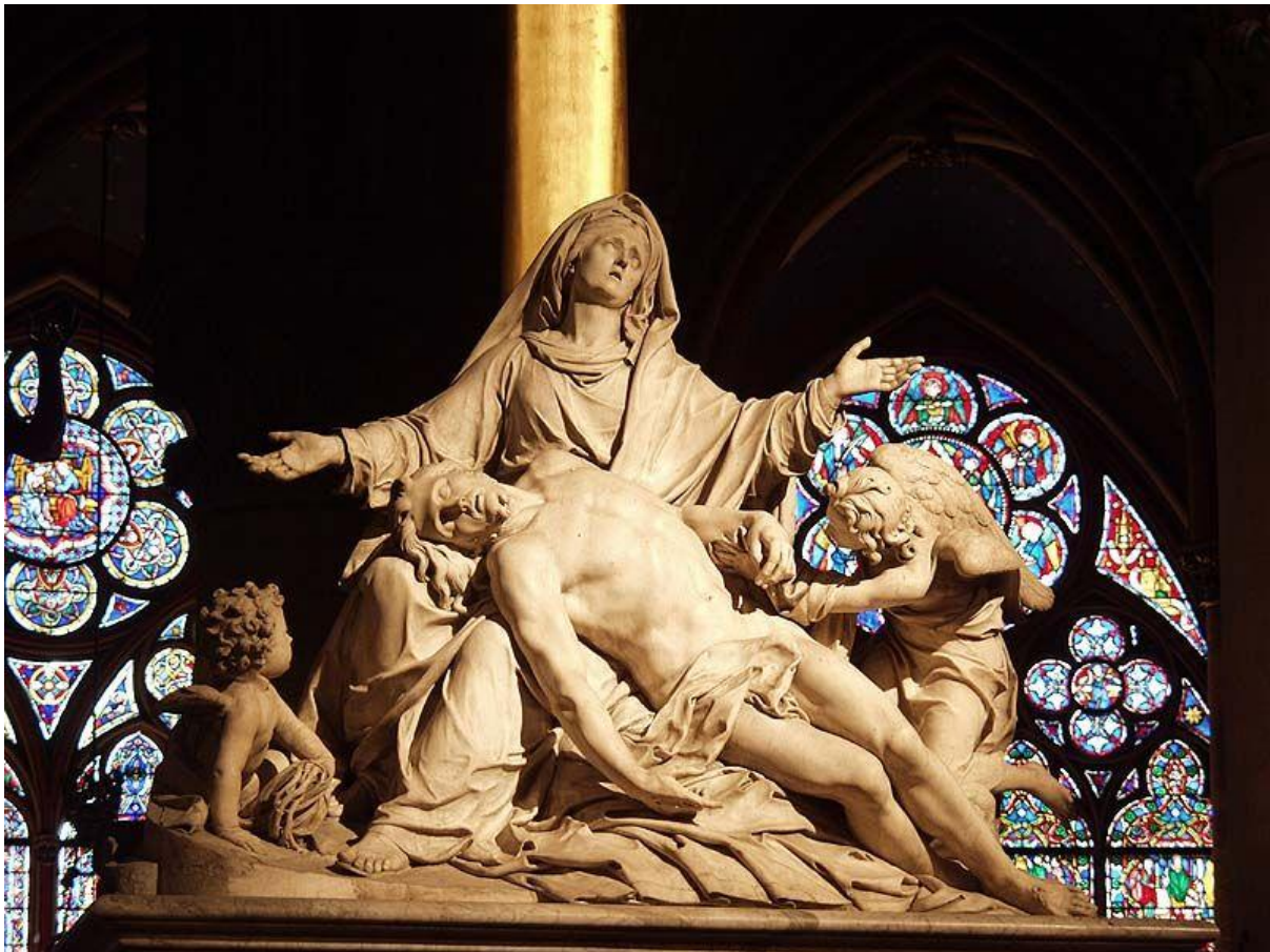
Pietà, i Notre Dame skabt af Nicolas Coustou i 1723.

Tirsdag aften gik Præsident Macron igen ud på direkte tv i en kort tale til nationen fra Elyséepalæet. Han lovede, at katedralen vil blive genopbygget: