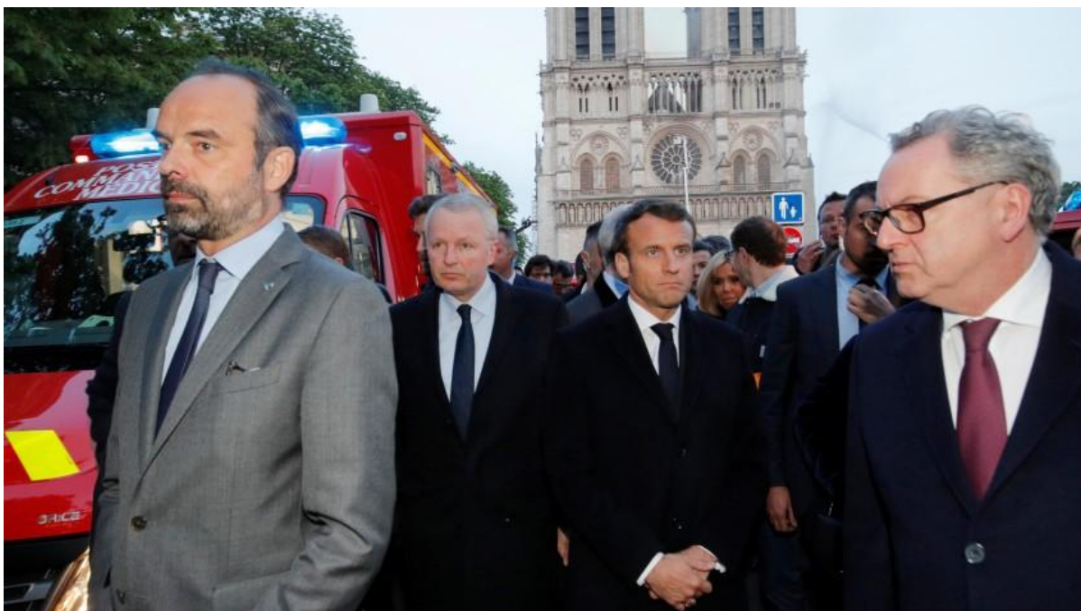
En alvorspræget Præsident Macron 15. april om aftenen ved den brændende katedral.

Stående ved brandstedet trådte Emmanuel Macron frem som landsfaderen, der på direkte tv – selv dybt berørt - talte til sine franske medborgere, der var i chok og sorg og til verden, der også begræd, at dette også af turister elskede vartegn for Paris var i fare for at falde i ruiner. Det var for mig et af de smukkeste og håbefulde øjeblikke i denne mørke nat, hvor flammehavet oplyste himlen over Paris, idet det var tydeligt mærkbart, at Præsident Macron i dyb samklang med den franske folkesjæl talte i den strøm af guddommelig hjælp, den favnende og omsluttende Jesus-kærlighed, der fra de indre riger af kærlighed og visdom lige på det tidspunkt blev frigivet til Frankrigs fortsatte hjertecenterudvikling. Også hans ord til sit folk om, at "det er vores historie, som står i flammer. Notre Dame er en del af vores skæbne. Den vil blive genopbygget. Vi får brug for hjælp, men vi skal få den genopbygget" , vidnede om det højere bevidsthedsniveau, som Macron virker fra. Endvidere takkede han brandkorpset for deres mod, beslutsomhed og dygtige håndtering af den ekstremt kritiske situation.