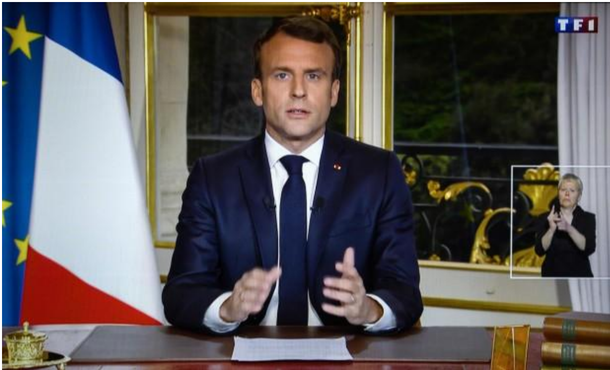
Præsident Emmanuel Macron i tv-tale til nationen fra Elyséespalæet d. 16. april 2019.