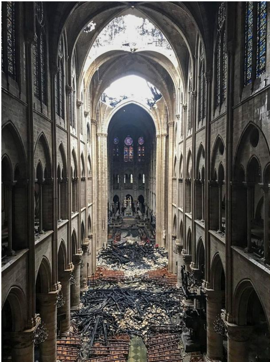
Notre Dame d. 16. april 2019 - dagen efter branden.

franskmænd formulere flere nuancer omkring betydningen af den brændende Notre Dame katedral, som "Frankrigs hjerte brænder" , "det er ikke blot Notre Dame, der brænder. Hele Frankrig brænder" , "vi er tvunget helt i knæ" , "hele Paris græder" , "hele Frankrig sørger" , "Frankrigs historie brænder" , "vor nationale identitet brænder" , og mange andre chokerede og sorgfulde udsagn. Også en af domkirkepræsterne udtrykte sin fortvivlelse, da han på direkte tv fortalte, at hans anrøb hele aftenen havde været: "Hvorfor Gud???" , og så tilføjede han lidt opgivende: "Jeg får det først at vide, når jeg er i Himlen" . Og vi så med bevægelse, at grupper af franskmænd stod sammen i Paris' gader syngende en Maria-hymne, en bøn om Marias hjælp, som gentog sig den følgende tirsdag eftermiddag, nu stående tæt på Notre Dame.