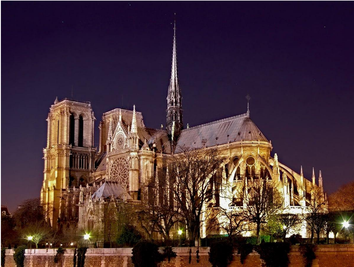
Notre Dame, Paris' domkirke, Frankrigs hjerte set fra Seinen.