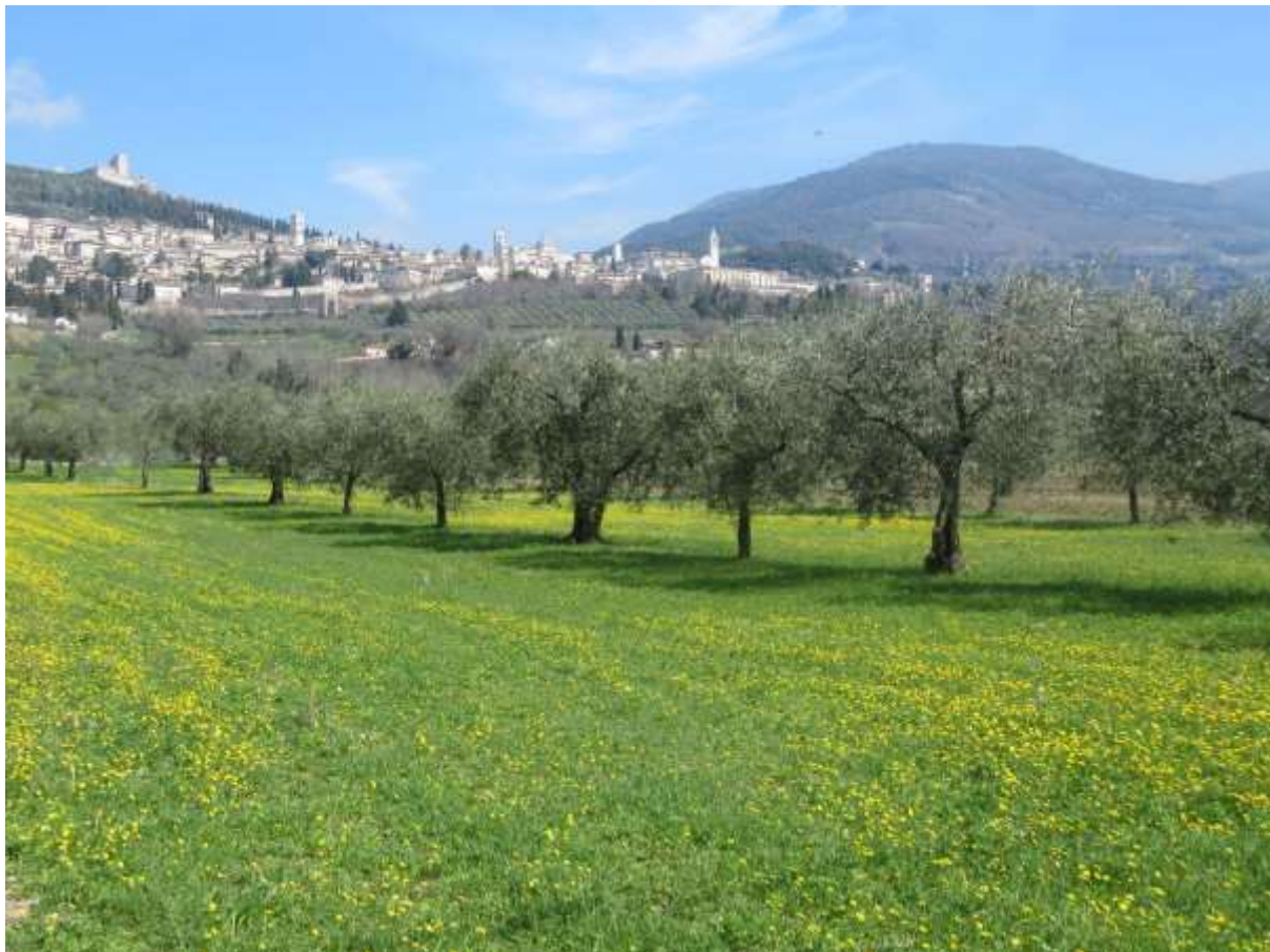
Små gule og hvide blomster pryder olivenlunden ved foden af Assisi her over midten af marts.