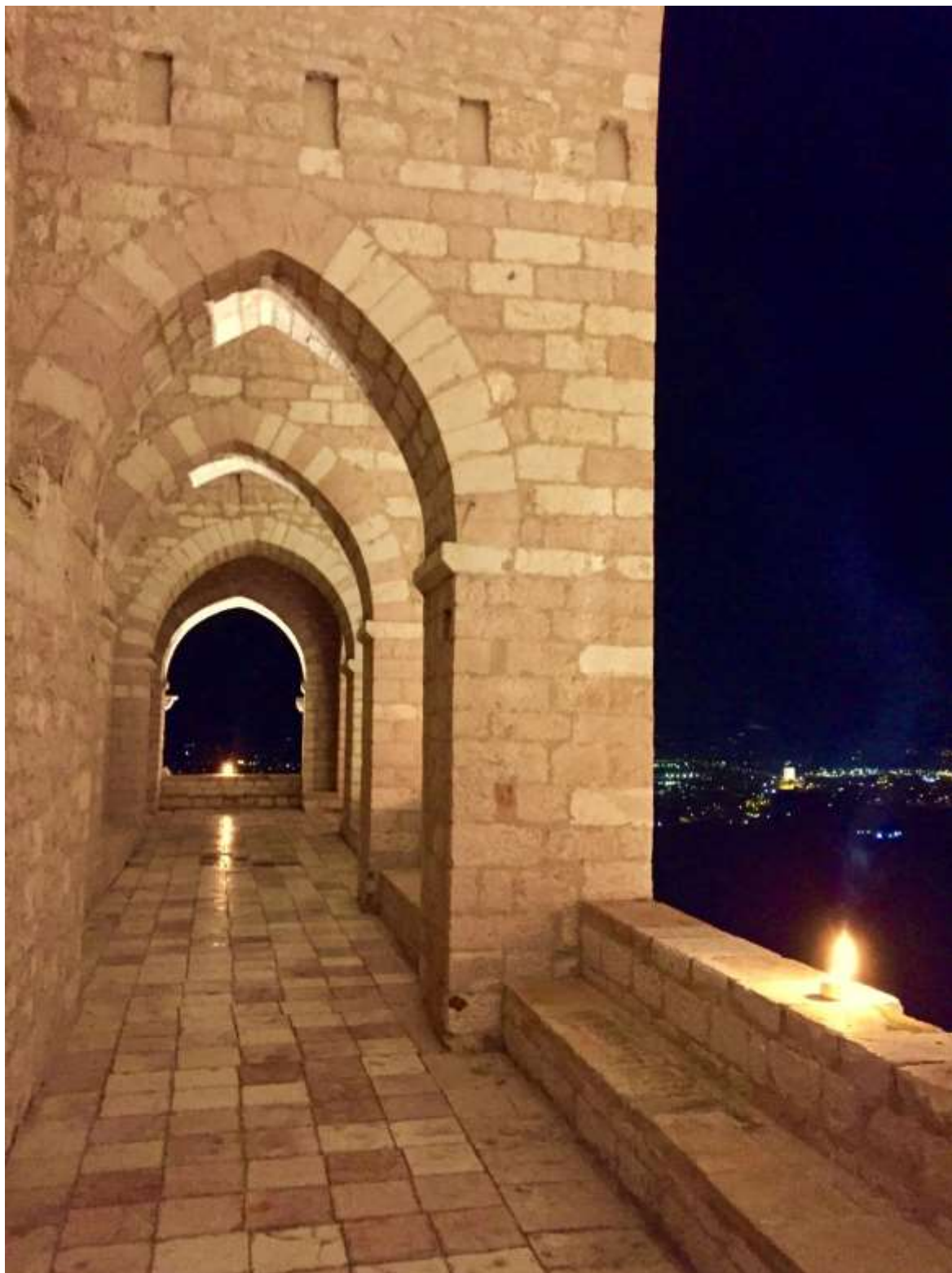
I Søjlegangene på Sacro Convento har brødre tændt lys som symbol på håb og tro.