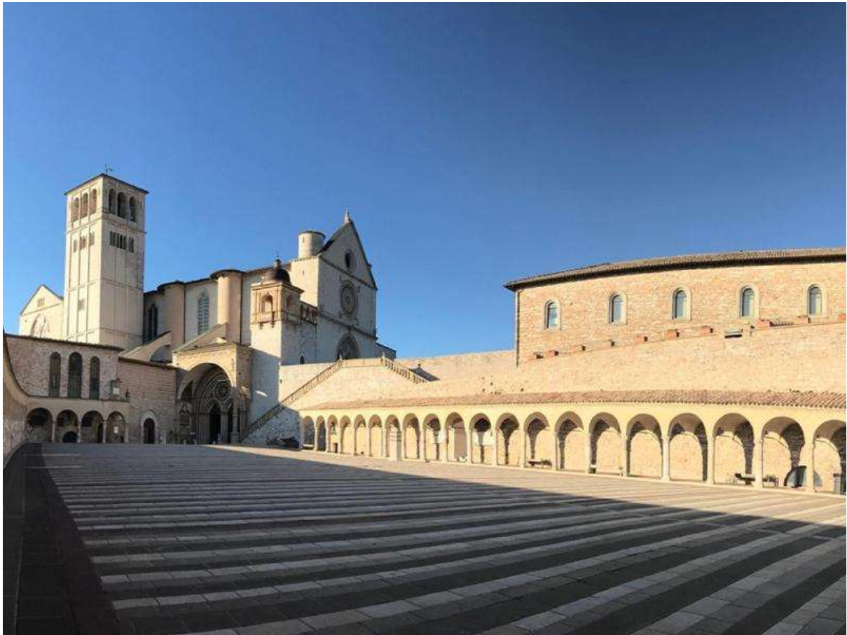
Basilica di San Francesco og Piazza Inferiore over midten af marts 2020. Pladsen er helt uden mennesker nu i 3. uge af marts.